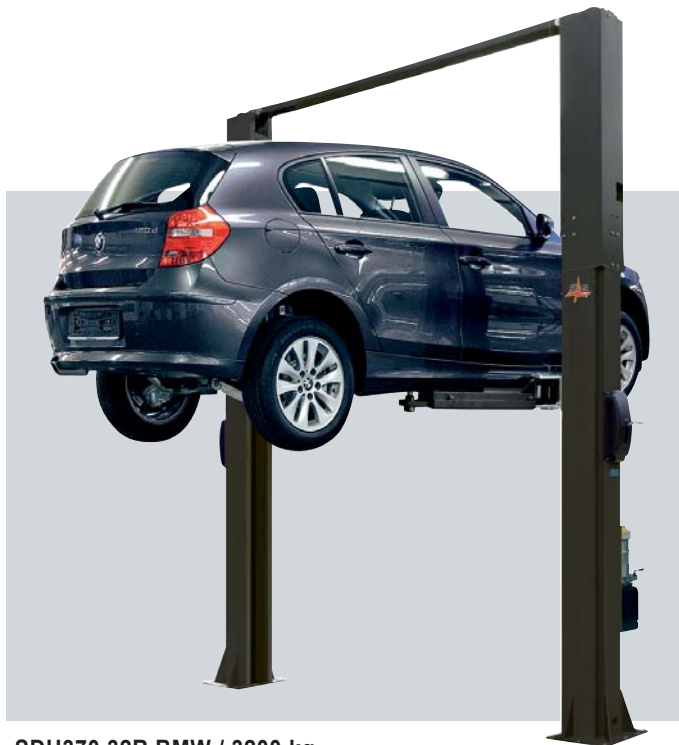
SDH370.32R BMW / 3200 kg HYDRAULIC / HYDRAULISCH

Sämtliche Hebebühnen tragen die CE-Kennzeichnung und erfüllen die Anforderungen strenger Baunormen zur Gewährleistung der absoluten Betriebssicherheit.