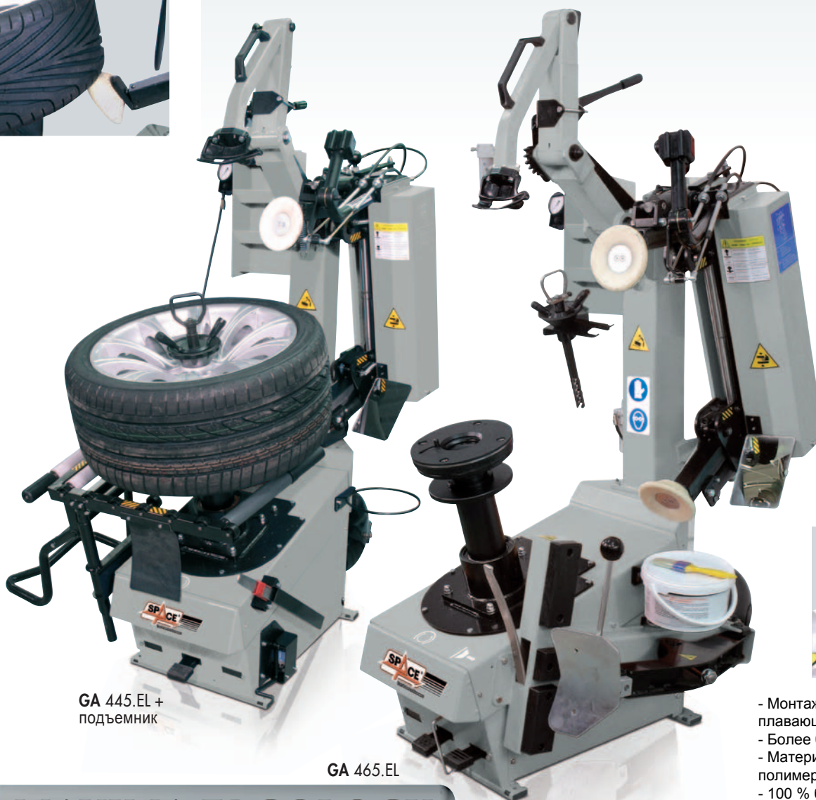
GA 445.EL + подъемник